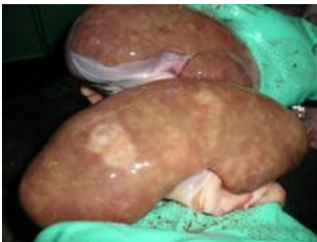
Fig. 5 Manchas blanquecinas

Tomando en cuenta que desde el punto de vista patológico los efectos de Ocratoxina y Citrinina son similares es posible que las lesiones que se han observado en casos de campo sean debidas a la acción de ambas. Sin embargo en los análisis de detección de micotoxinas, la que se detecta en raciones sospechosas fue la Ocratoxina. Los signos clínicos reportados como indicativos de intoxicación con Ocratoxina son polidipsia y poliuria pero en porcinos que consumen agua ad-libitum a partir de bebederos automáticos y en algunas ocasiones están en jaulas de piso elevado estos signos clínicos no son fácilmente registrados. En exámenes postmortem realizados en animales que se presumían afectados por esta micotoxina las lesiones renales que se observaron macroscópicamente fueron; manchas blancas en la superficie del riñón las cuales variaron de tamaño desde un puntilleo difuso hasta manchas de forma irregular fácilmente distinguibles (Fig. 5). Otra lesión notable fueron los quistes en riñón, se presentaron tanto en forma individual como varios quistes en el mismo riñón (Fig. 6). En el examen histopatológico se observaron cambios degenerativos severos tanto en túbulos proximales como distales así como un leve infiltrado difuso de células redondas y algunas células plasmáticas. Las úlceras gástricas han sido relacionadas con este tipo de micotoxinas.