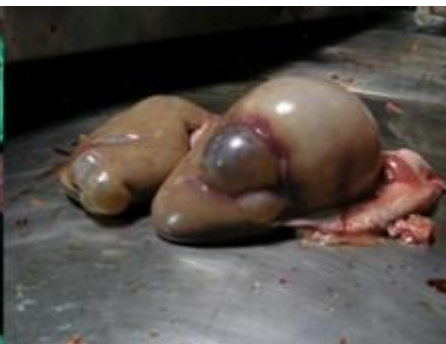
Fig. 6 Quistes en riñón