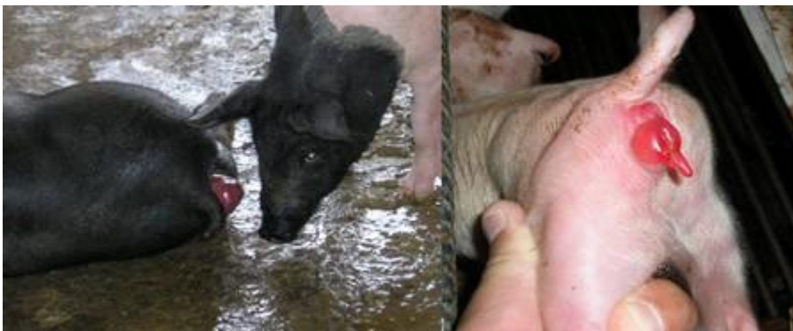
Fig. 12 Prolapso rectal