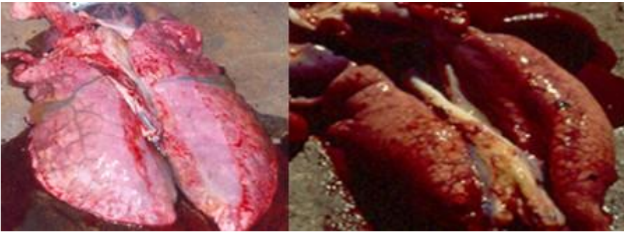
Fig. 7 Edema interlobular y en mediastino sin presencia de neumonía

mecanismos de limpieza pulmonar se deprimieron en una forma que resultó estadísticamente significativa 13 . Este tipo de hallazgos aportan una explicación lógica al fenómeno que ha sido observado varias veces a nivel de campo que cuando hay intoxicación con Fumonisina otras enfermedades toman una mayor fuerza y severidad 13 .