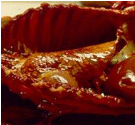
Fig. 1 Tonalidad amarillenta en órganos y tejidos

ingiriendo alimento contaminado con micotoxinas, la proporción de micotoxinas ingeridas por kilo de peso corporal se mantienen por debajo de la dosis que puede causar daño, por lo tanto no se observa ningún signo clínico en las cerdas. Durante la lactancia, el volumen de la ración que recibe aumenta considerablemente puede llegar a consumir hasta 8 o 9 Kg de alimento por día. La Aflatoxina es una toxina que puede eliminarse por leche, una cerda que quizá no presenta signos de intoxicación puede estar pasando Aflatoxina en leche a su camada en cantidades que pueden ser pequeñas pero suficientes para intoxicar a un animal de menos de 2 Kg de peso corporal 2 . En la región se han observado lechones de pocos días de edad con severo daño hepático que seguramente fueron intoxicados a través de la leche materna. En algunas cerdas hay rechazo voluntario de alimento, quizá se puede tratar de un caso de instinto maternal en el que la cerda opta por evitar el alimento para de esta manera proteger a su camada.