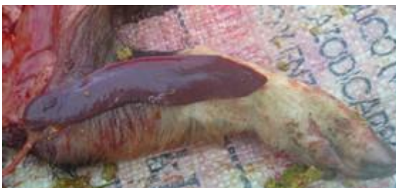
Fig. 3 Bazo reducido de tamaño