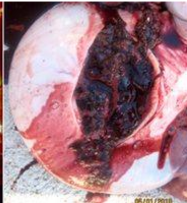
Fig. 2 Ulcera gástrica