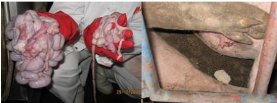
Fig. 10 Cuerpos lúteos, Hidrometra