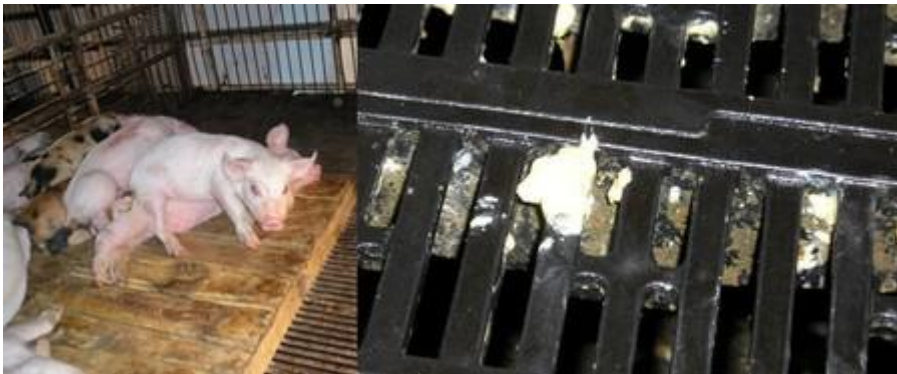
Fig. 8 Vomitoxina Rehúsanconsumir alimento

Resulta interesante observar que la alta predisposición a enfermedades infecciosas que se ve en casos de campo también puede estar relacionada con estas micotoxinas. En estudios experimentales la respuesta inmune se vió disminuida en forma gradual coincidiendo con la dosificación de toxina a la que los cerdos habían estado expuestos 7 .